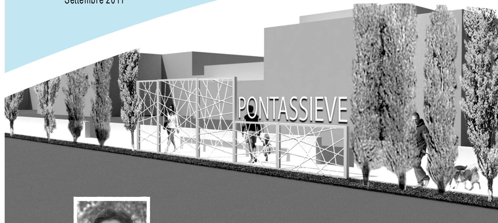
Dettaglio del progetto per l'area industriale di via Lisbona