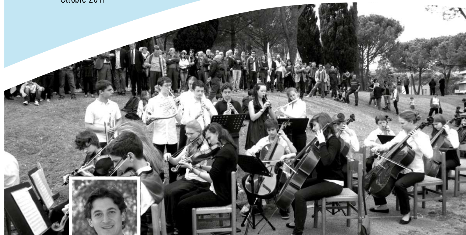
Un momento dell'inaugurazione della scultura del Pegaso a "I Villini"

Diaz. Sono stati raccolti molti sacchi di rifiuti tra carta, indifferenziato e multimateriale oltre a oggetti a dir poco inusuali gettati sull'argine della Sieve, come un ombrello, un vano motore e un cofano di un'autovettura. Da parte dell'amministrazione un ringraziamento a tutti i volontari, alle associazioni coinvolte e alla sezione Soci Coop Valdisieve per la merenda offerta a tutti i partecipanti.