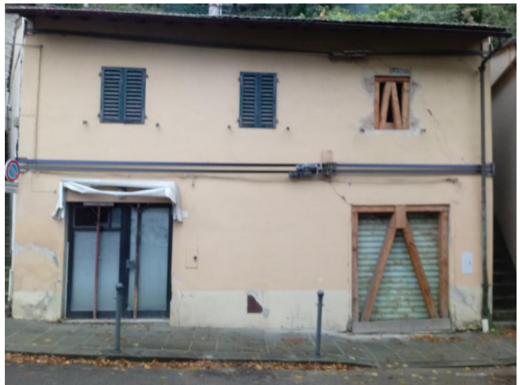
Fronte su Via Piana