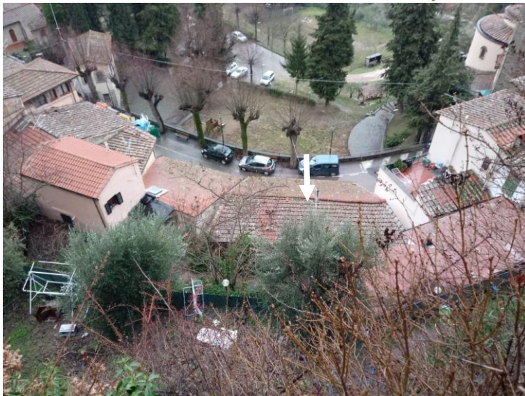
Vista da monte