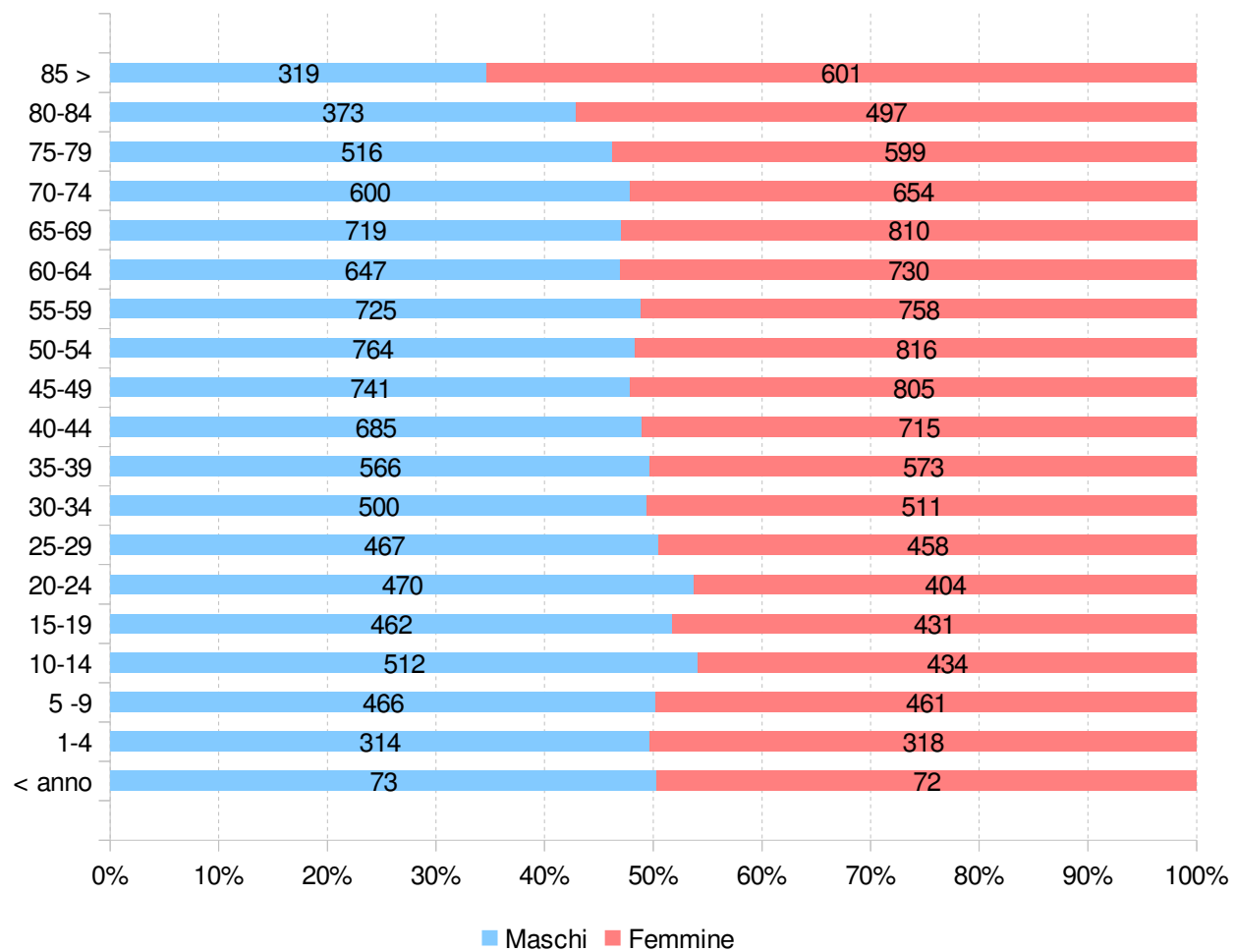
Popolazione residente al 31/12/2017 iscritta all'anagrafe del Comune di Pontassieve suddivisa per classi di età e sesso