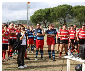
Progetto Rugby Integrato