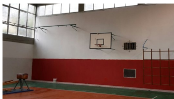
Palestra Molino del Piano

scelte degli investimenti pubblici e lo saranno anche nell'immediato futuro con alcuni interventi che stanno per partire e altri che sono già stati programmati e finanziati. Da ricordare il rinnovamento della PALESTRA MALTONI - con la realizzazione della nuova tribuna ( 500.000 euro finanziati con mutuo a tasso zero dell'Istituto Credito Sportivo) - e della PALESTRA DI MONTEBONELLO ( 205.000 euro fondi PNRR). Importanti lavori anche a MOLINO DEL PIANO hanno riguardato sia l'interno della palestra che la copertura, dove è stato rimosso l'amianto presente. Stanno per iniziare i lavori alla PALESTRA della GALILEI di Sieci , finalizzati alla riqualifica-