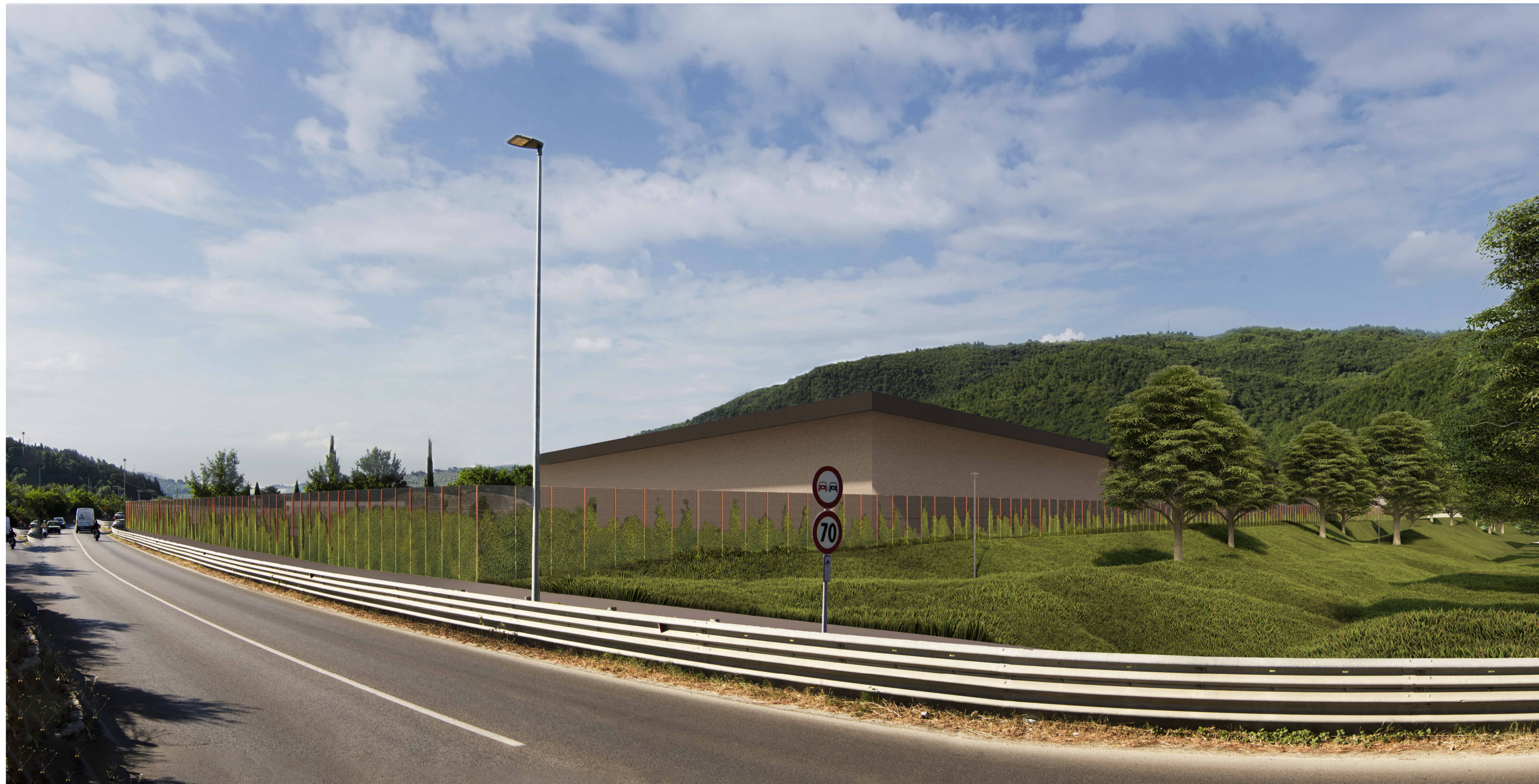
C) VISTE DA SS.67 ARETINA: IL POLO AGROALIMENTARE DEL "CASTELLARE" E' ARRETRATO OLTRE 30m DALLA STRADA E PIU' IN BASSO RISPETTO A QUEST'ULTIMA. LATERALMENTE IL PROSPETTO VERRA' MITIGATO DAL "CORRIDOIO" VERDE.