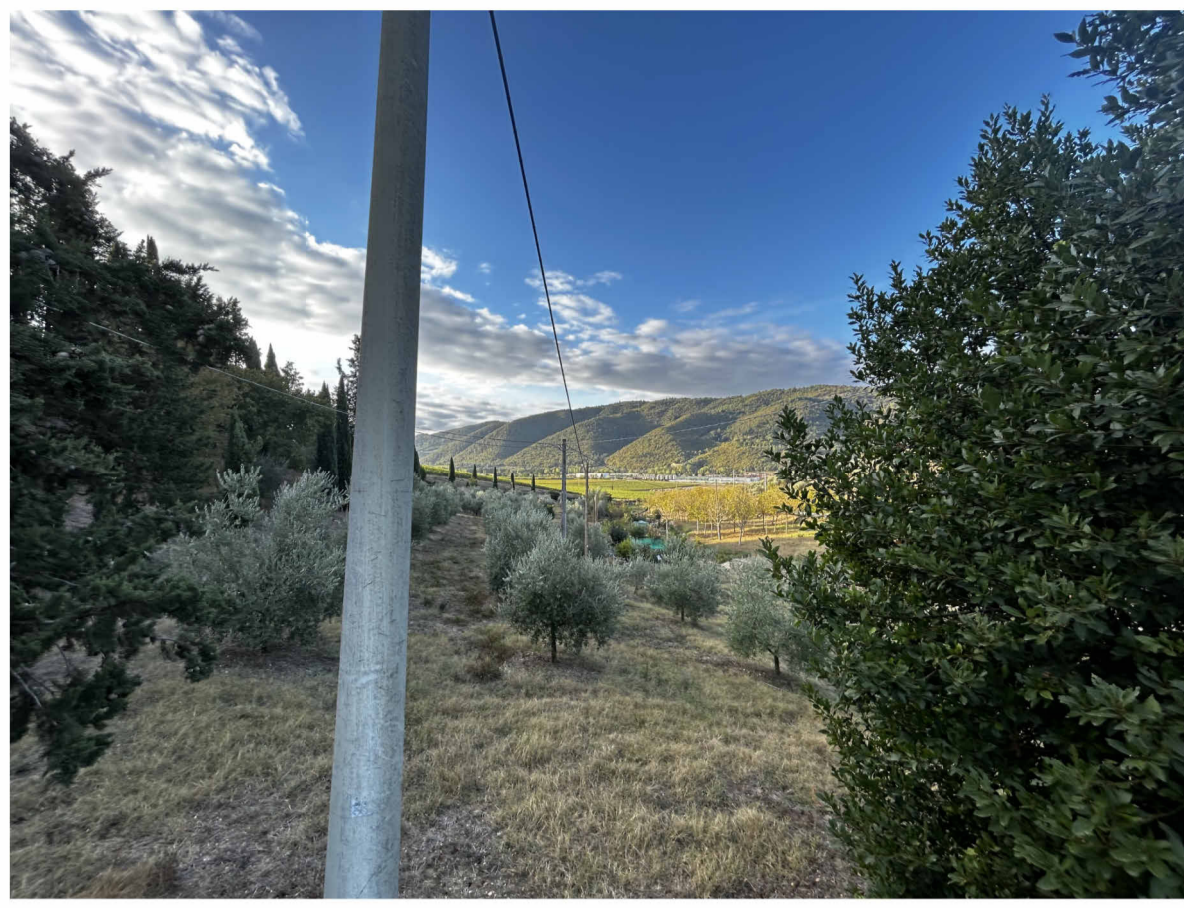
A) VISTE DA VIA DEI MANDORLI: IL POLO AGROALIMENTARE DEL "CASTELLARE" NON E' VISIBILE