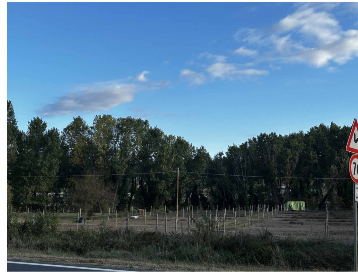
B) VISTE DALLA SP.90 DI ROSANO: IL POLO AGROALIMENTARE DEL "CASTELLARE" NON E' VISIBILE